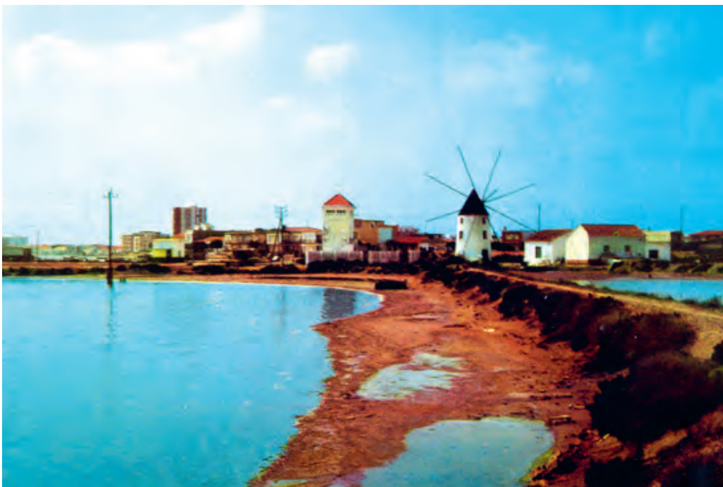
Foto 1: Postal Molino Quintín. Propiedad: Salinera Española. h. década70.

terreno de la burguesía local, y terminando por los núcleos agrícolas más alejados como era el caso de los ubicados en La Loma de Arriba, Molino de Chirrete, o Los Sáez.