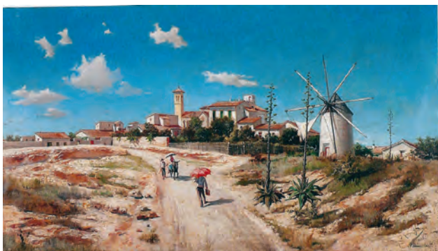
Foto 2: Molino de la hacienda del Barón de Benifayó. Óleo del pintor murciano Marín Baldo.

Al igual que cuando uno viaja desde San Pedro del Pinatar a Cartagena y se queda impresionado, cual Quijote por la cantidad de molinos que encuentra a lo largo del camino, imaginarse la delicia de acercarse a San Pedro con sólo 21 kilómetros cuadrados y disfrutar en movimiento de una docena de molinos con sus velas latinas al viento, simulando ángeles costeros, como denominó Carmen Conde en sus "Poemas del Mar Menor" "a los molinos Quintín y La Ezequiela, y