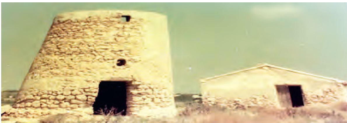
Foto 4: Molino y caseta de máquinas del Principal. (Salinera Española)