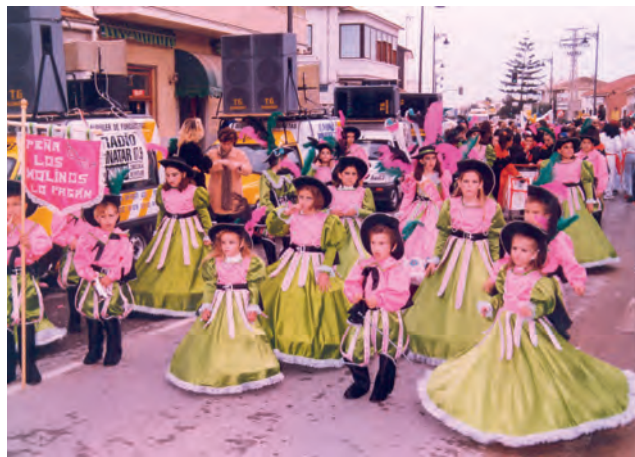
Foto 7: Foto de la peña “Los Molinos”, en los Carnavales de San Pedro del Pinatar

Durante décadas la Peña “Los Molinos” de Lo Pagán, han ido participando en los carnavales tanto locales como comarcales con el estandarte al frente, donde podemos leer el nombre de la peña bordado en este.