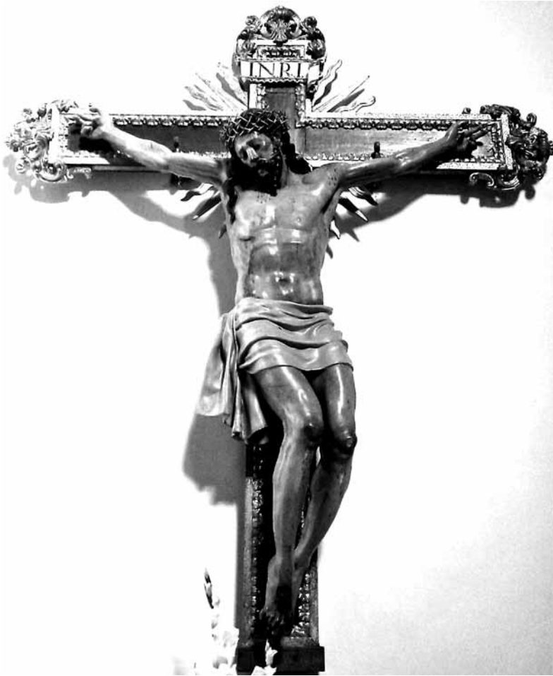
Cristo de la Misericordia (iglesia de Nuestra Señora de la Concepción, Caravaca de la Cruz)